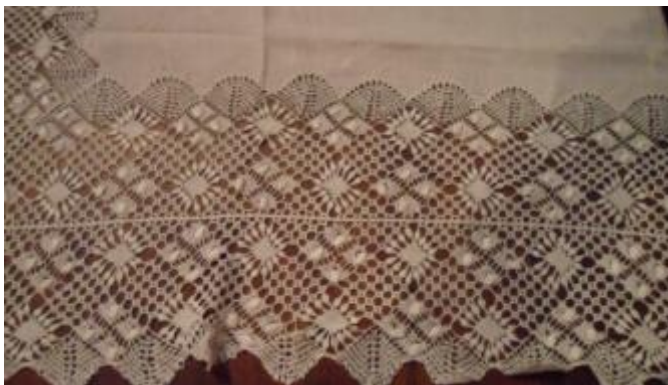
Text 175 – Passos – IMSRL