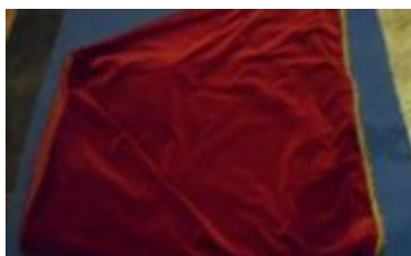
Text 47 – Cobertura do plinto do andor Senhor dos Passos – IMSRL