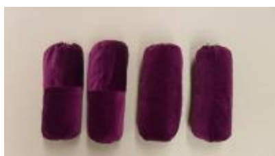
Text 41 – Almofadas rolo – IMSRL