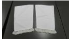
Enxoval da imagem do