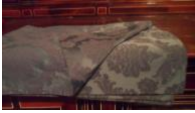
Text 49 – Colcha – IMSRL