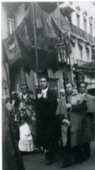
Text 54 – Capa e cabeção de Confraria – IMSRL