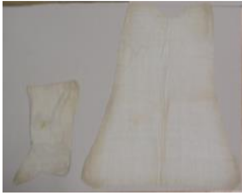
Text 201 – (vestimenta de São Roque) – IMSRL