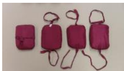
Text 42 – Almofadas – IMSRL