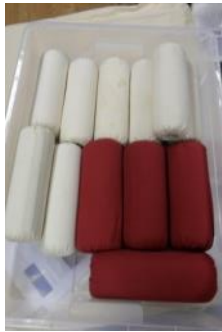
Text 62 – Almofadas rolo – IMSRL