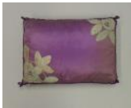
Text 7 - IMSRL Túnica e almofada Senhor dos Passos –