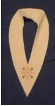
Text 129 - Estola de Ministro da Comunhão – IMSRL