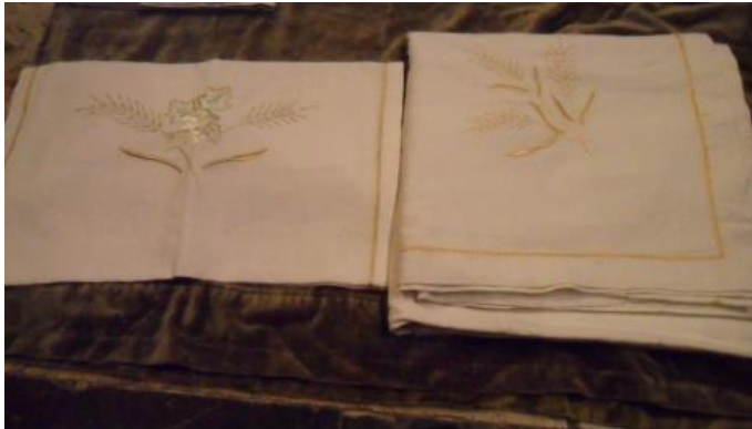
Text 171 – – IMSRL