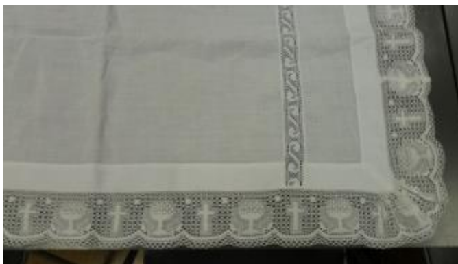
Text 177 – Laterais (uso comum) - IMSRL