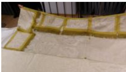
Text 64 – Cortina de Pálio (branca) – IMSRL