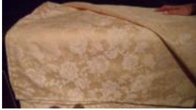
Text 50 – Colcha – IMSRL