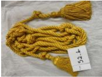
Text 52 – Cíngulo da Túnica do Senhor dos Passos – IMSRL