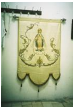
Text 35 – Estandarte da Arquiconfraria S. S. mo Coração de Maria da Igreja do Mosteiro da Encarnação – IMSRL