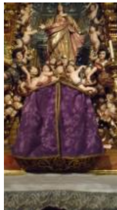
Conjunto de paramentos (roxo) – IMSRL