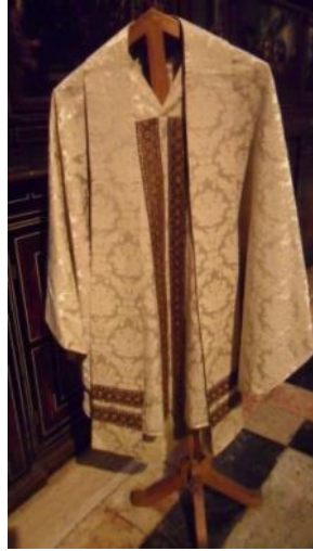
Text 73 – Roque) – IMSRL