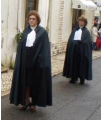
Text 55 – Capa e cabeção de Confraria – IMSRL