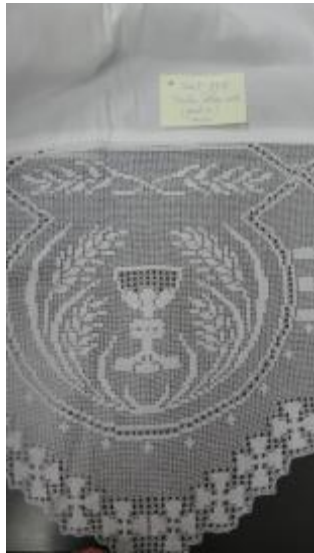
Text 178 _ IMSRL