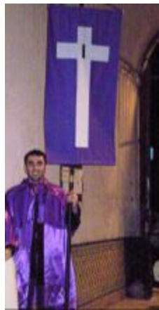
Text 63 – Painel do Passo – IMSRL