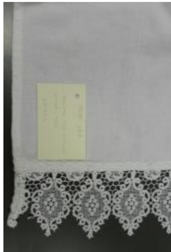
Text 187 – IMSRL