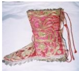
Vestimenta «rica» de S. Roque – IMSRL