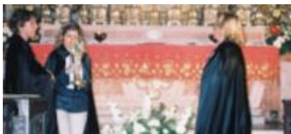
Text 66 – Vesperal (vermelho) – IMSRL