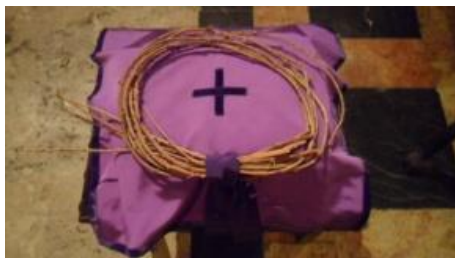
Text 9 – Coroa de Espinhos – IMSRL