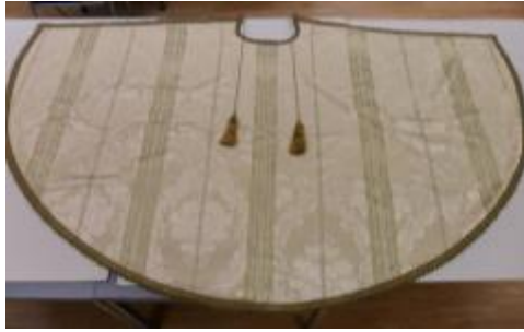
Text 5 - contemporânea de São Roque – IMSRL