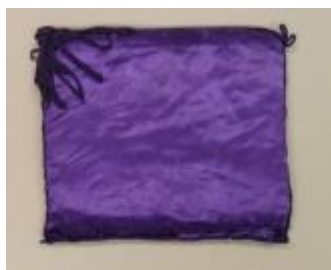
Text 44 – Almofada/Sr. dos Passos – IMSRL