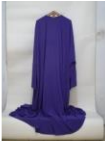
Text 6 - Túnica Senhor dos Passos – IMSRL